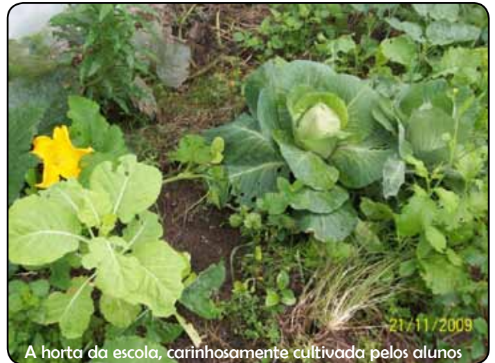
A horta da escola, carinhosamente cultivada pelos alunos