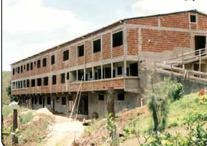
Novo Lar Metodista em fase de acabamento

(32)3215-7703/3211-2811/amasjf@amasjf.com.br