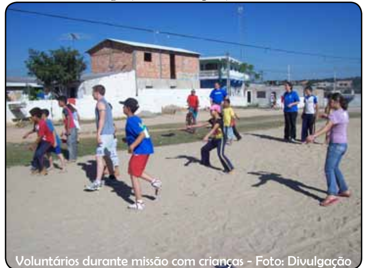
Voluntários durante missão com crianças

Os frutos são bons e numerosos! Destaco aqui a ação de várias igrejas locais que já não se satisfazem