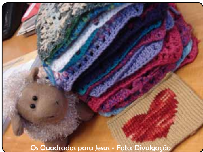
Os Quadrados para Jesus