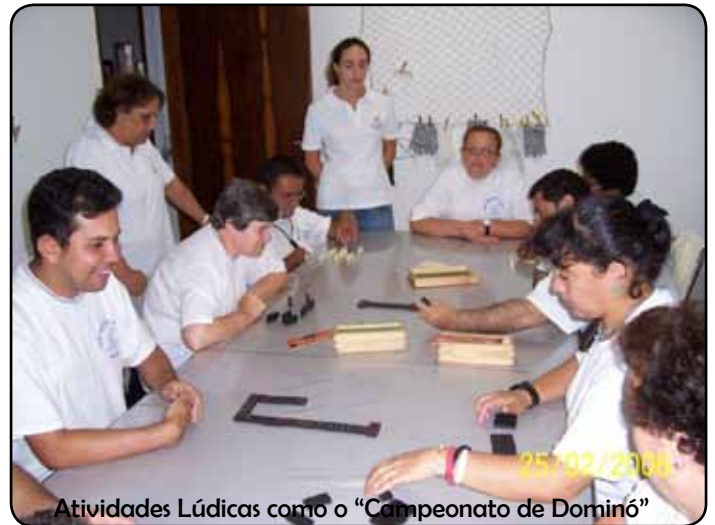
Atividades Lúdicas como o “Campeonato de Dominó”

na Universidade Metodista de São Paulo. Em suas salas oferece ensino fundamental (1ª a 4ª), ensino religioso, atendimento psicológico, fisioterapia, educação para o trabalho, música, lazer... Nestas páginas, você está convidado a “dar um passeio” pela escola. Venha com a gente!