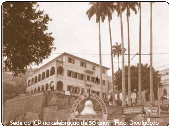
Sede do ICP na celebração de 50 anos

Ele atua numa área onde vivem cerca de 400 mil moradores dos Morros da Providência, Gamboa e Saúde, e também do bairro do Santo Cristo, Central do Brasil e Zona Portuária. Além de oferecer