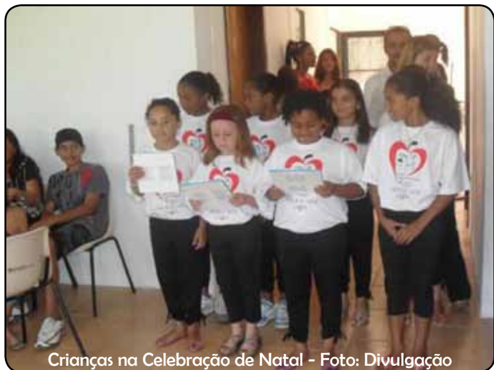
Crianças na Celebração de Natal - Foto: Divulgação