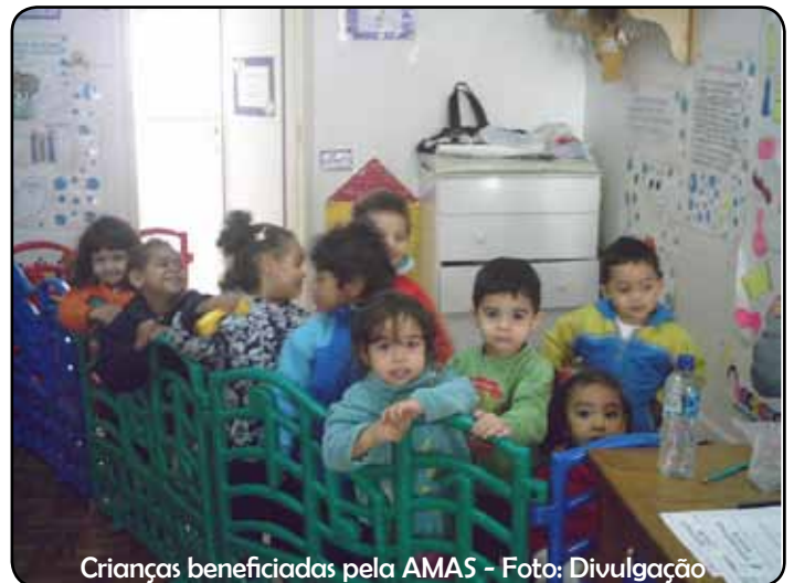
Crianças beneficiadas pela AMAS