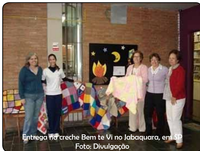
Entrega na creche Bem te Vi no Jabaquara, em SP