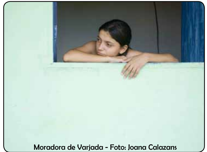
Moradora de Varjada

Isso ocorre através do impulso de duas soluções de concentrações diferentes que se encontram separadas por uma membrana semipermeável. Várias camadas finas e unidas que são enroladas em espiral ao redor de um tubo plástico, permitindo, assim, que atravesse a água, sendo retidos os sólidos dissolvidos. Quando a água a ser tratada passa através da superfície da membrana é coletada água potável no centro do tubo.