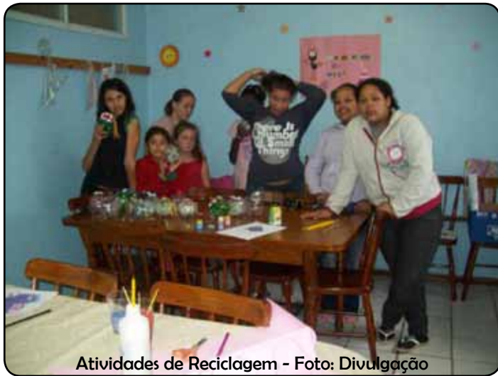
Atividades de Reciclagem