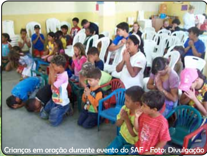
Crianças em oração durante evento do SAF

em acolher apenas as crianças e adolescentes e por isso expandem esse acolhimento também às famílias dessas crianças.