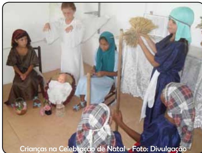
Crianças na Celebração de Natal

Essa situação tem propiciado o surgimento e agravamento dos diversos problemas sociais que abalam a vida da sua população. E são de um modo geral, as crianças e os adolescentes as maiores vítimas disso tudo. A violência no meio familiar tem impedido o desenvolvimento saudável das crianças e dos adolescentes. Em muitos casos é nas crianças e nos adolescentes que é depositada a insatisfa-