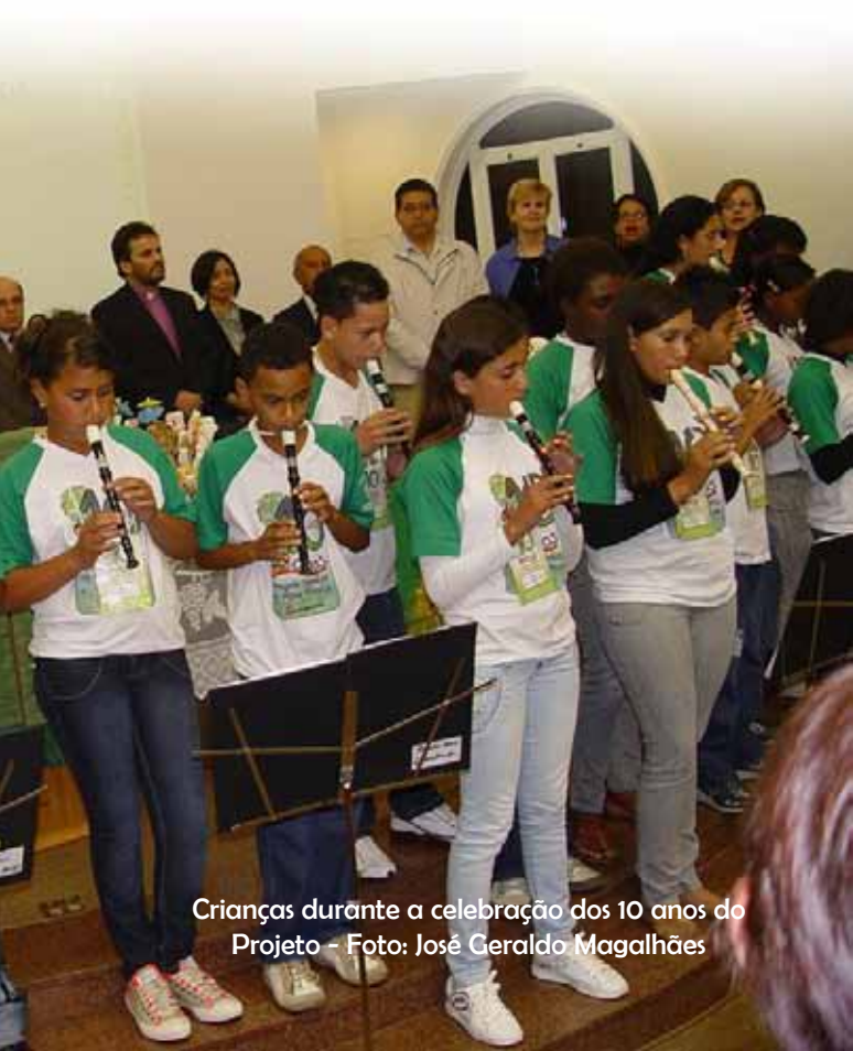
Crianças durante a celebração dos 10 anos do Projeto

A Educação Cristã é o núcleo básico e essencial do Projeto Sombra e Água Fresca. E para que ela aconteça de forma sistemática, criativa e contextualizada uma grande equipe de educadores cristãos produziu um material específico para uso nos projetos. São três cadernos elaborados