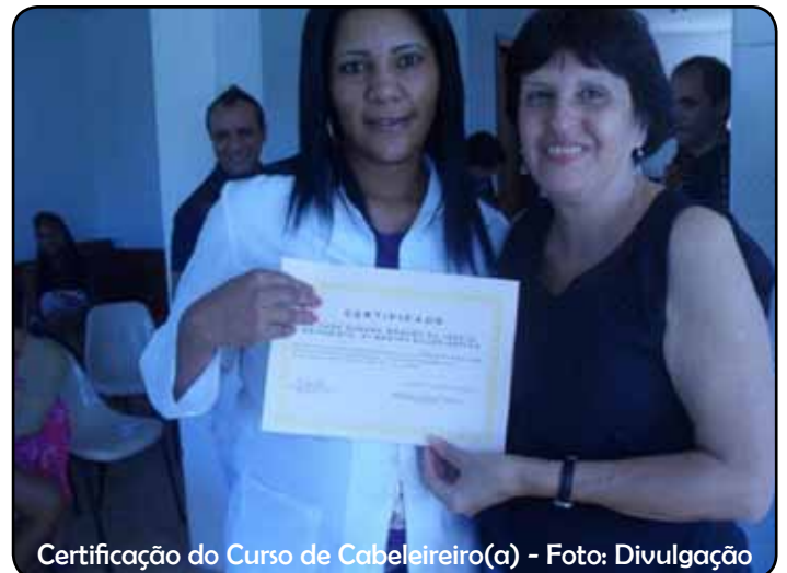
Certificação do Curso de Cabeleireiro(a)

A abrigagem é uma medida de proteção às meninas e adolescentes para garantir sua segurança e sobrevivência. Às meninas e adolescentes abrigadas é oferecido, em atendimento individualizado: acolhida amorosa; apoios espiritual, psicológico e social; tratamentos médico e odontológico; atendimento às necessidades nutricionais, de higiene e