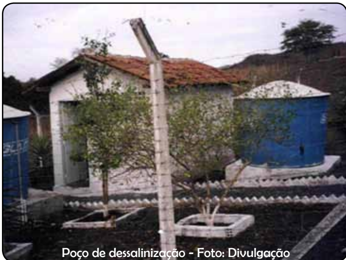
Poço de dessalinização

O sistema dessalinizador padrão tem capacidade em média de 25 metros cúbicos de água por dia e funciona por meio de osmose reversa.