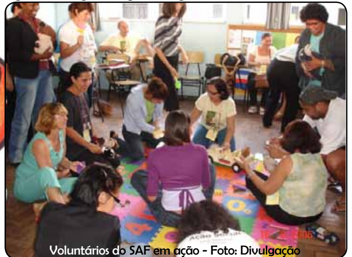
Voluntários do SAF em ação

Como costume dizer, o Projeto Sombra e Água Fresca é uma semente de amor coloca por Deus no coração da Igreja Metodista brasileira para ajudá-la a cumprir sua missão junto à criança e o adolescente empobrecidos do nosso País. Para mim tem sido muito gratificante participar de seu desenvolvimento e poder testemunhar, através das ações desenvolvidas, o grande amor de Deus por aqueles e aquelas que são prioridade em seu reino.