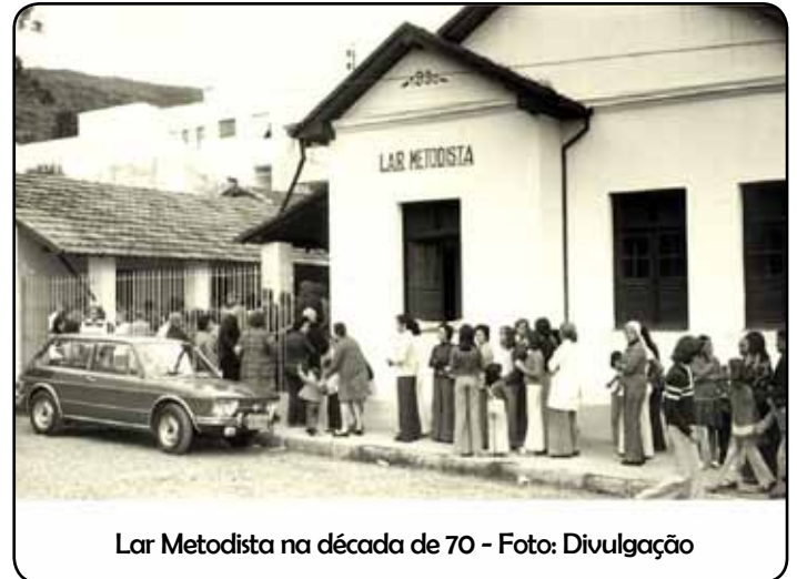
Lar Metodista na década de 70

A obra contempla três pavimentos com área de reabilitação, piscina térmica, almoxarifado, lavanderia, apartamento e moradia do administrador, 18 dormitórios, refeitório, enfermaria, sala de TV, 10 quitinetes, alojamento para funcionários entre outros, tudo isso somado numa área de 2100 metros quadrados de área construída.