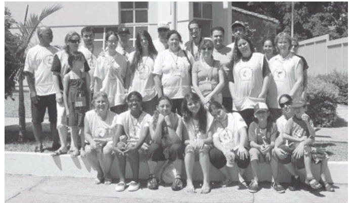
Viagem teve como objetivo a evangelização de paraguaios

Para participar da viagem missionária é necessário que o interessado seja membro ativo de uma