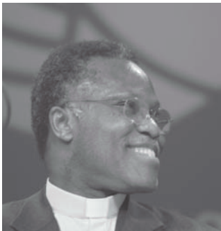
Pastor metodista Samuel Kobia, secretário geral do CMI

Durante a abertura, foram apresentados os relatórios do moderador e do secretário-geral. Aram I, líder da Igreja Apostólica Armênia, disse que as igrejas podem construir um "ecumenismo relevante e de credibilidade" neste período de convulsão social.