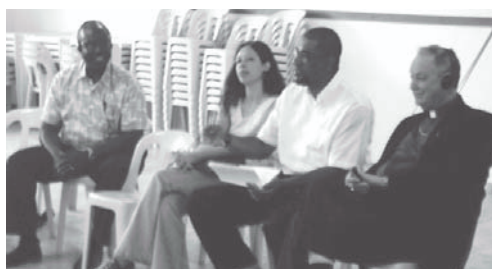
Encontro reuniu bispos, pastores e pastoras da 2ª Região