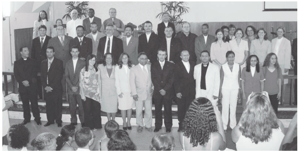
Foram ordenados 30 presbíteros/as e uma pastora

O Espírito Santo marca a Igreja com alguns sinais, características específicas que estavam presentes