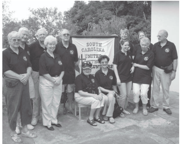
Os visitantes integram o Projeto “Voluntários Metodistas em Missão”