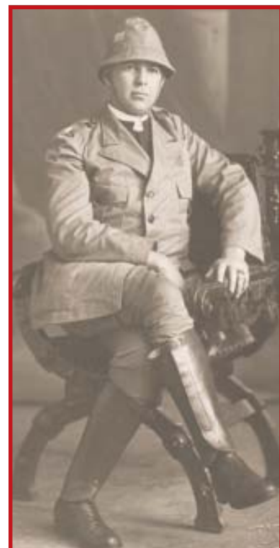
Rev. Guaracy Silveira, liderança que se destacou no processo de autonomia e na política nacional: foi o primeiro evangélico eleito para a Câmara Federal, em 1933, pelo Partido Socialista Brasileiro. Nesta foto, com a farda de capelão da Revolução Constitucionalista de 1932.