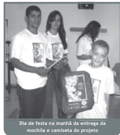
Dia de festa na manhã da entrega da mochila e camiseta do projeto