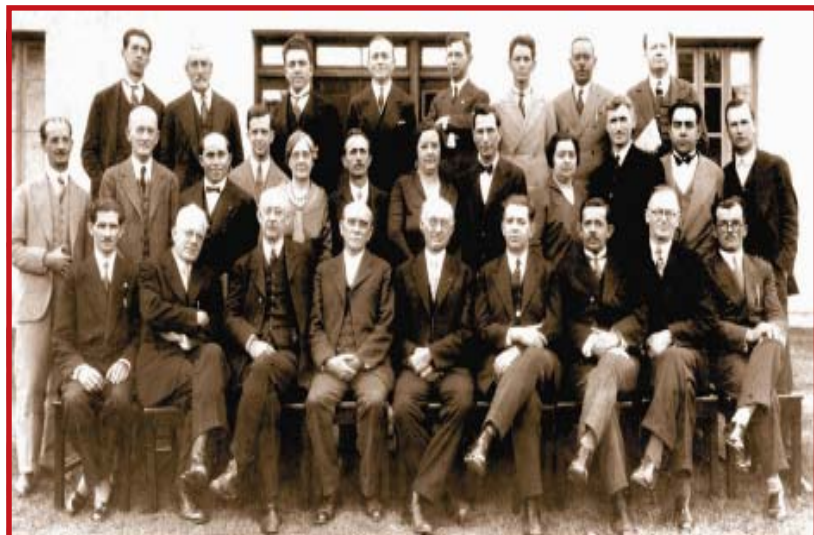
Foto oficial do Primeiro Concílio Geral da Igreja Metodista do Brasil, ocorrido na Igreja Metodista Central de São Paulo, de 2 a 9 de setembro de 1930.

Veja, a seguir, algumas fotos deste período marcante para a história do metodismo brasileiro e conheça algumas personalidades que contribuíram consideravelmente com este movimento.