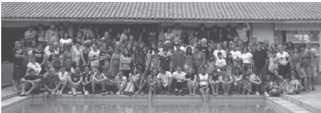
Igreja Metodista em Rudge Ramos