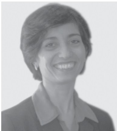
Arquivo: Sede Nacional