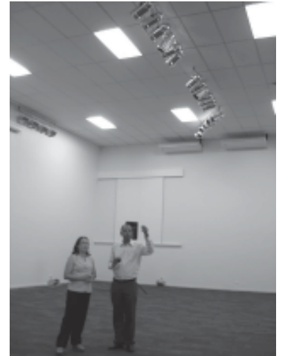
Espaço para 500 pessoas com iluminação especial e telão.