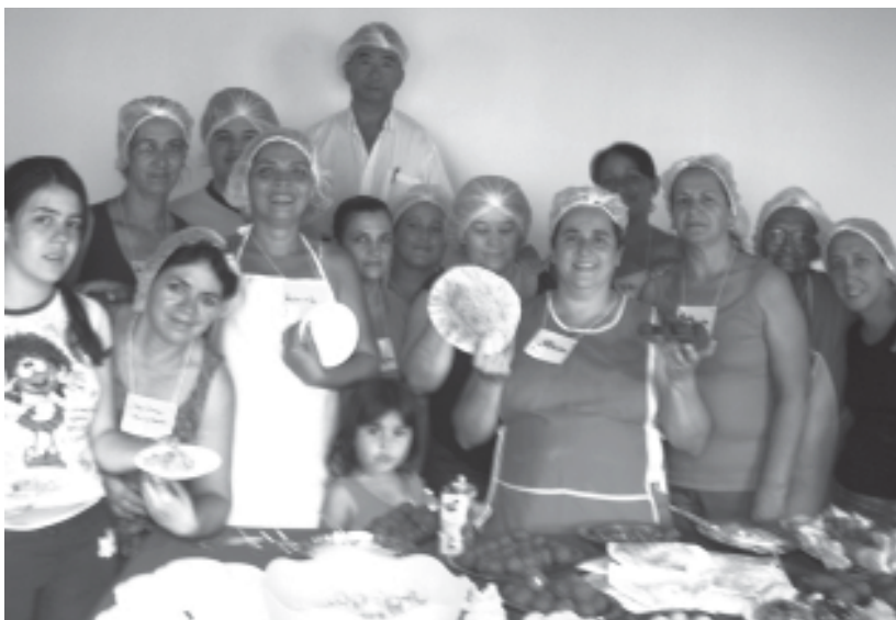
O curso de culinária da Igreja em Anápolis: capacitação oferecida a mulheres e homens