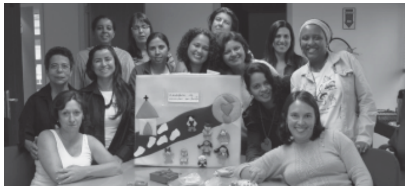
A animada equipe do DNTC: esforço de todas as regiões para fazer um belo trabalho envolvendo as crianças.

O tema 2009 do DNTC - "A aventura de caminhar com Cristo" - foi orientador nas devocionais, trazendo à memória as crianças de cada canto do país. Na primeira devocional de acolhida, a equipe recebeu o desenho de um pé simbolizando os passos a serem dados durante este ano. Então, cada coordenadora expressou como sonha a caminhada com as crianças. Um caminho com possibilidades, esperança, percepção, ensino, sensibilidade, capacidade, tranquilidade e bem. E ainda neste caminho também a responsabilidade de construir, desconstruir e influenciar mais pessoas. Par-