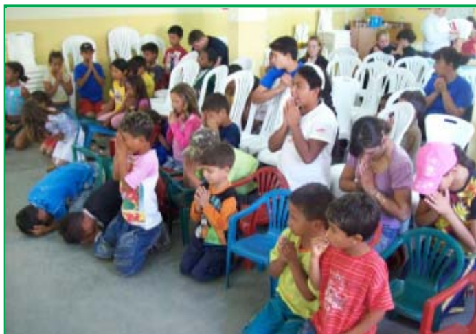
Crianças participantes do Projeto Sombra e Água Fresca.

Este ano, o projeto “ Jovens Mãos à Obra ” acontecerá nos períodos de 13 a 25 de junho e de 19 a 26 de junho, no Instituto Central do Povo (ICP), e de 24 de julho a 29 de agosto, no Acampamento Clay. A Federação Metodista de Jovens, em parceria com o projeto Voluntários em Missão, da área de Expansão Missionária