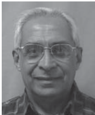
Arquivo: Sede Nacional