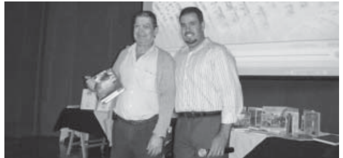
Equipamentos de ginástica do Parque da Maturidade (acima) e a entrega de Bíblia a um frequentador

EDITORA METODISTA Crescendo junto com o seu conhecimento.