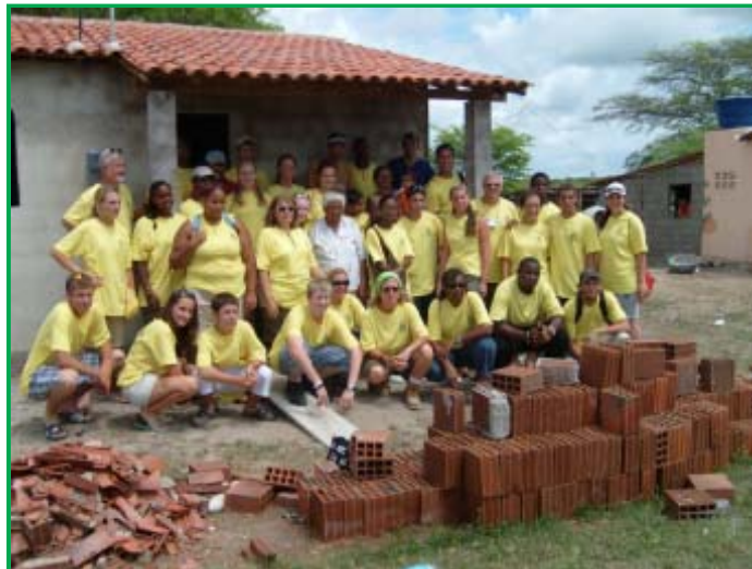
Projeto Varjada: equipe de voluntários(as) em frente à casa de alvenaria recém-construída. Cisternas também foram construídas em regime de mutirão.

A partir das demandas da comunidade, foram realizadas reuniões com o prefeito que se comprometeu a construir o Posto de Saúde e da escola para ampliação do ensino na comunidade. Até que o posto fique pronto, a Igreja e a ONG Habitat mantêm um médico e uma enfermeira para atendimentos de emergência.