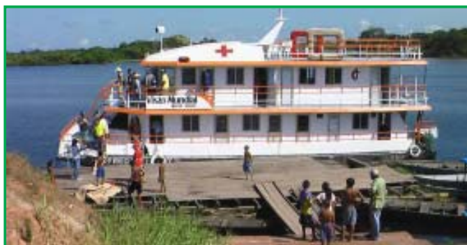
Barco Hospital: ação missionária nas comunidades ribeirinhas da Amazônia.