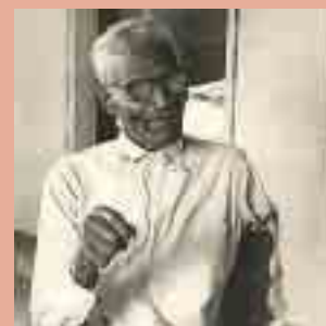
João Cândido em foto de 1963.

- O problema é essa história de negro, negro, negro... Eu havia sido atropelado, não pelas piadinhas tipo tiziu, pudim de asfalto etc, mas pelo panzer do racismo nazi-ideológico oficial”.