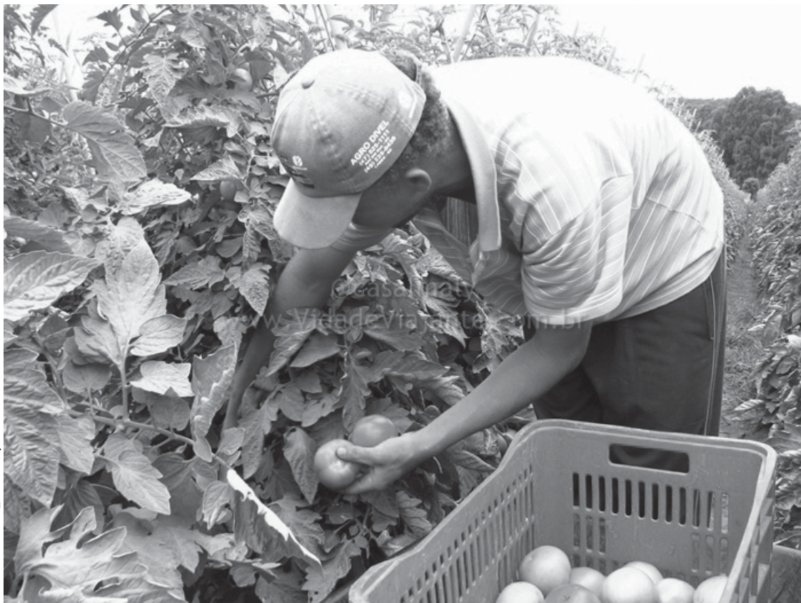
É tempo de semear e colher! A seara precisa de trabalhadores.

A participação do leigo foi decisiva para que Wesley pudesse expandir o movimento Metodista por toda a Inglaterra. Nos dias