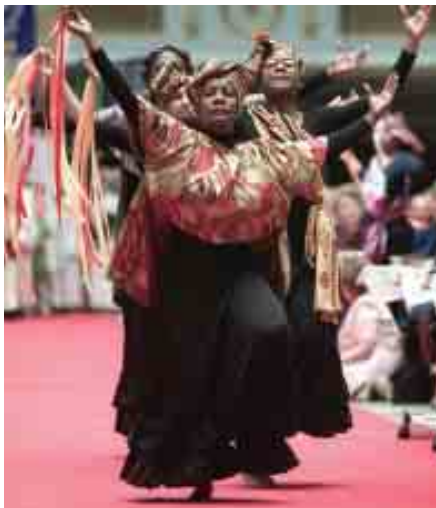
Dança litúrgica em celebração metodista