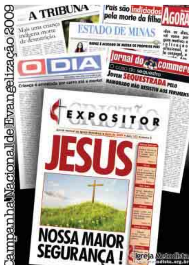
Campanha Nacional de Evangelização 2009