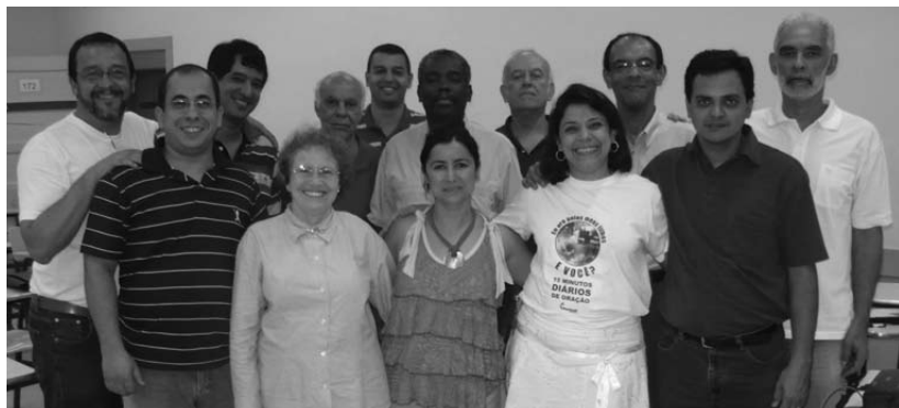
Participantes da consulta de Educação Cristã e Educação Teológica no Bennett, Rio de Janeiro.

A seguir, os destaques e encaminhamentos da Consulta de Educação Cristã e Educação Teológica, neste primeiro encontro: