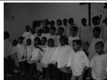
Cantata de Natal