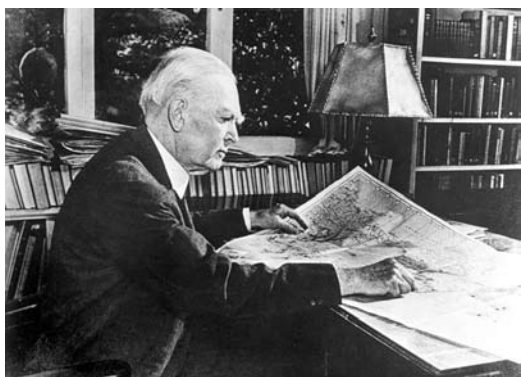
John Mott: seu sonho era “a evangelização do mundo nesta geração”

Este 2010, que fecha a primeira década do século XXI, será marcado pelo centenário da Conferência Missionária Mundial, realizada em Edimburgo (Escócia), de 2 a 6 de junho. Este evento é paradigmático para a reflexão em torno da missão cristã e seus desafios contemporâneos, e também, e com maior