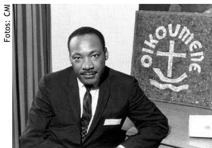
Martin Luther King, em visita ao CMI, em 1967. Ele pregaria na Assembleia no ano seguinte se não tivesse sido assassinado pouco antes.

A identidade do CMI está expressa na base constitucional aprovada em Amsterdã: “O Conselho Mundial de Igrejas é uma comunidade de igrejas que confessam a Jesus Cristo como Deus e Salvador, segundo o testemunho das Escrituras, e procuram responder juntas à sua vocação comum, para a glória do Deus único, Pai, filho e Espírito Santo”.