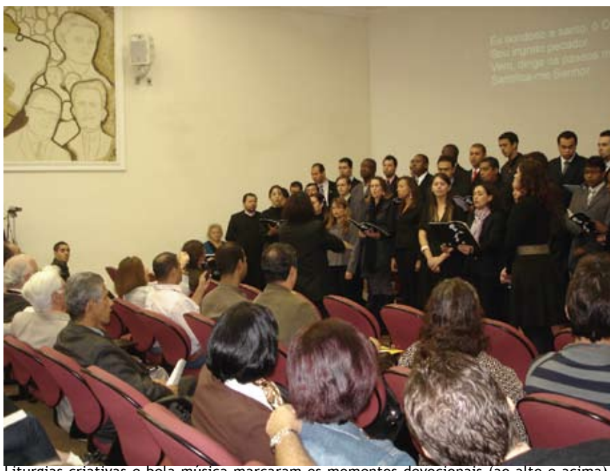
Liturgias criativas e bela música marcaram os momentos devocionais (ao alto e acima).