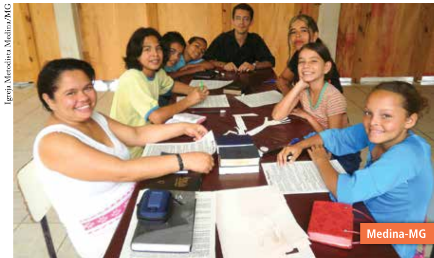
Igreja Metodista Medina/MG