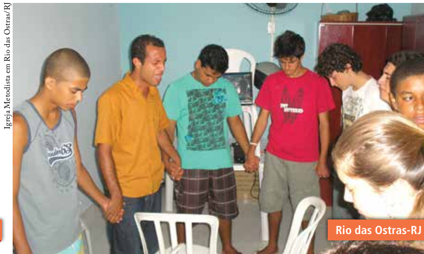
Igreja Metodista em Rio das Ostras/RJ