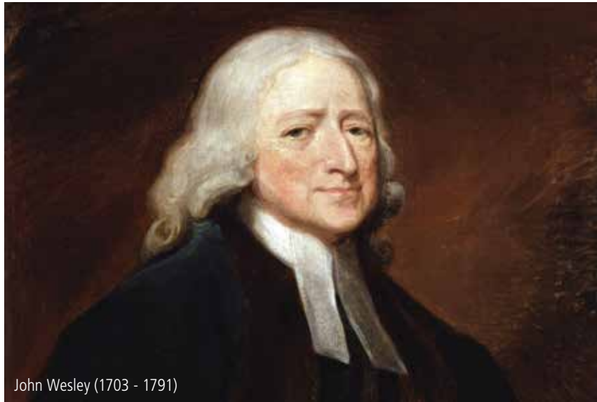
John Wesley (1703 - 1791)