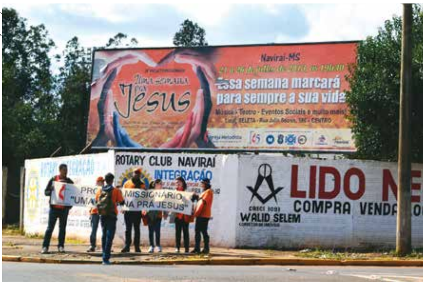
Em Naviraí/MS, nem o frio intimidou os metodistas que marcharam pelas ruas da cidade.