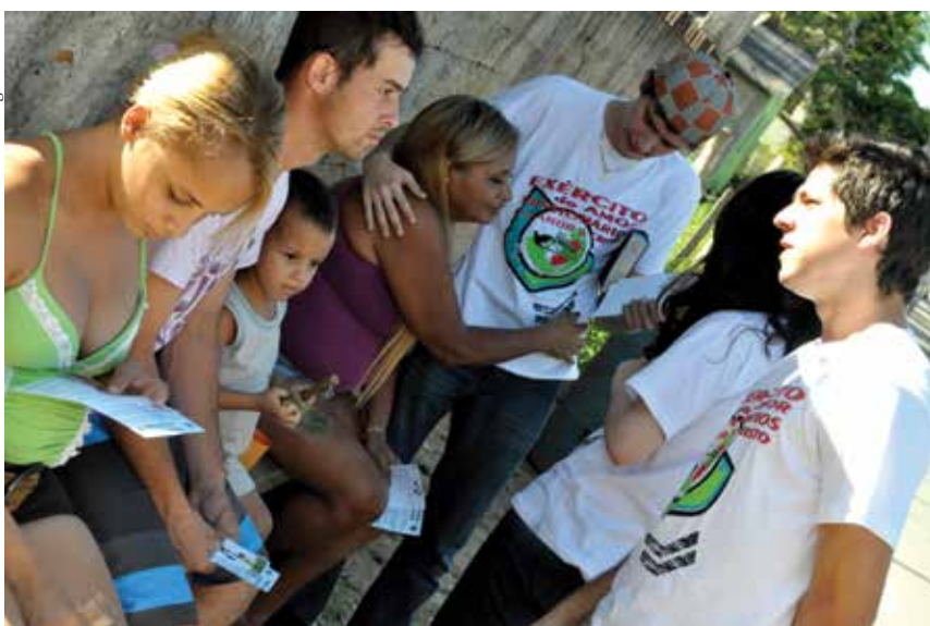
Evangelismo de rua durante projeto Passa à Macedônia em Jerônimo Monteiro/ES.