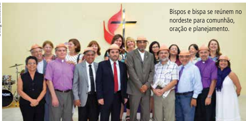
Bispos e bispa se reúnem no nordeste para comunhão, oração e planejamento.

Os bispos/a também trabalharam o Plano Estratégico Missionário da Igreja Metodista, definindo processos para formação de obreiros, estabelecimento de parcerias missionárias, processos e critérios para que se estabeleçam novas regiões missionárias, programas para o avanço