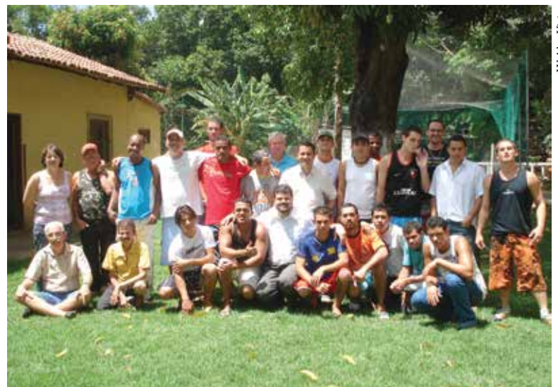
Comunidade Terapêutica Metodista em Serra/ES oferece tratamento para dezenas de jovens.