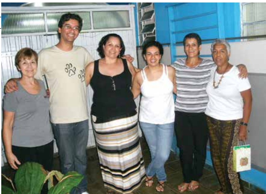
Grupo do Projeto Revide em Santo André/SP ajuda dependentes químicos e codependentes.