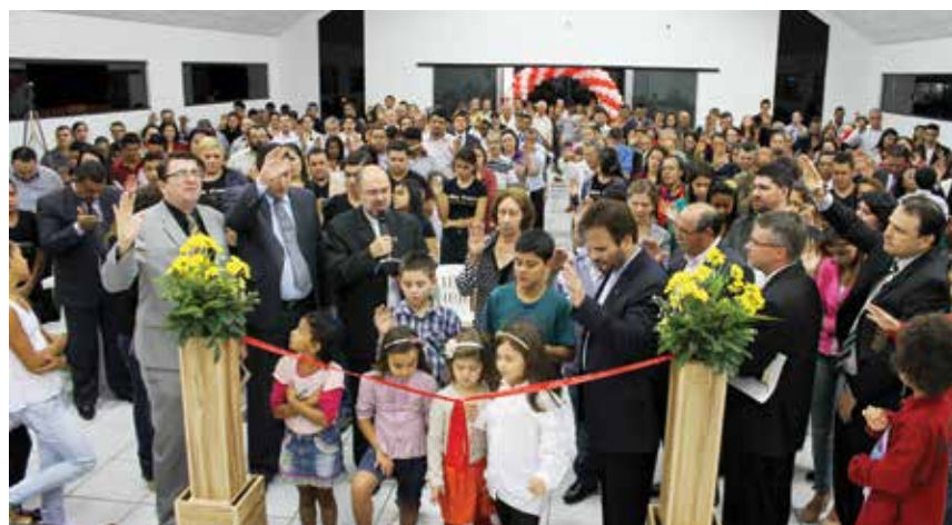
Inauguração do templo da Igreja Metodista em Eldorado/MS.