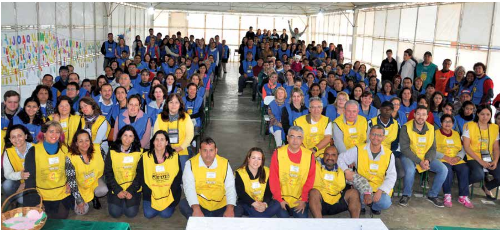
Projeto missionário Julho para Jesus reuniu 270 missionários/as em duas cidades no Paraná. Foi a 16ª edição da iniciativa na 6ª Região Eclesiástica.