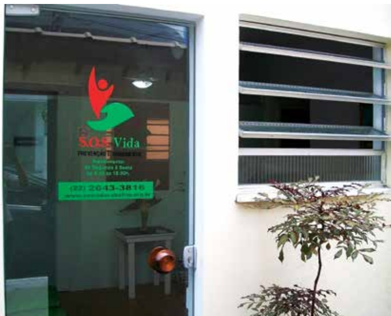
Projeto S.O.S. Vida em Cabo Frio/RJ funciona como ambulatório para dependentes.