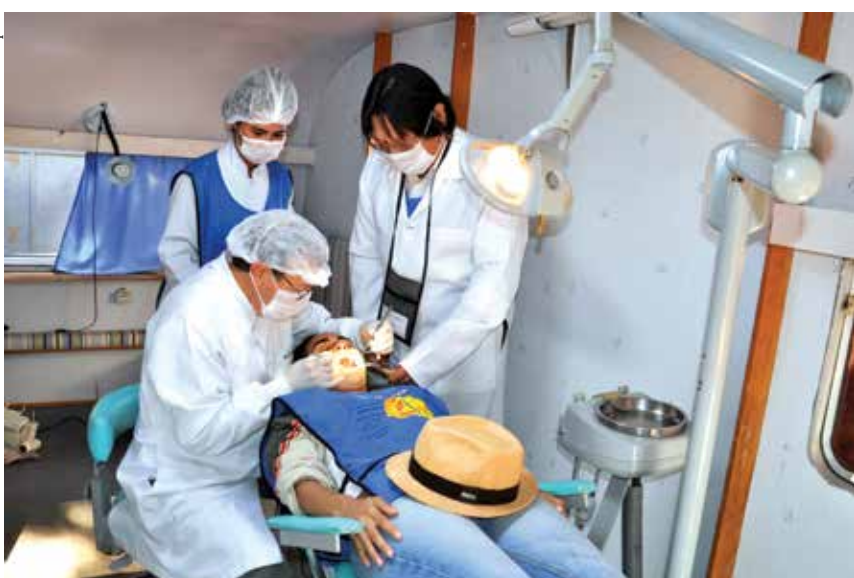
Atendimento odontológico gratuito oferecido pelos metodistas em Joaquim Távora/PR.