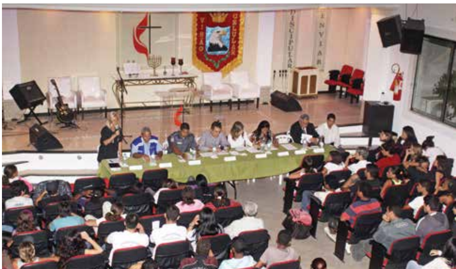
Palestra na Igreja Metodista em Búzios/RJ conscientiza metodistas sobre os perigos das drogas.

Uma série de encontros para capacitação foram realizados ao longo dos anos para aprimorar o atendimento. “A dinâmica de um grupo de apoio é oscilante, pois é fato que uma recaída, e às vezes a possibilidade dela, mexe com toda a família. Aprendemos nestes 17 anos de