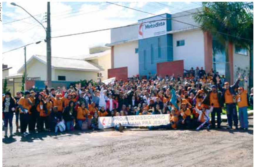
Ao todo, 470 metodistas participaram do projeto missionário da 5ª Região Eclesiástica.