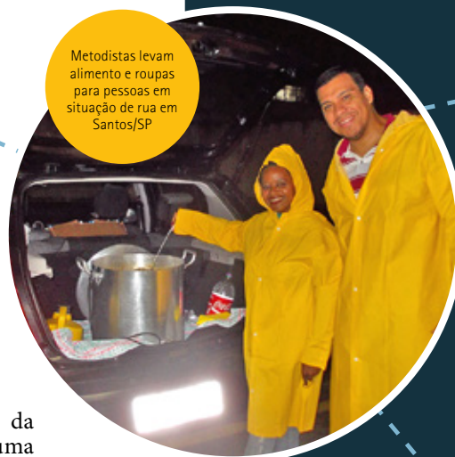
Metodistas levam alimento e roupas para pessoas em situação de rua em Santos/SP