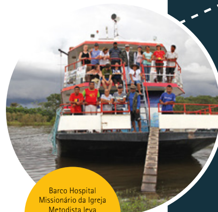
Barco Hospital Missionário da Igreja Metodista leva atendimento médico para ribeirinhos na região Amazônica