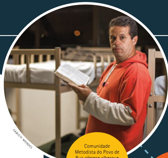
Comunidade Metodista do Povo de Rua oferece albergue e alimentação para pessoas em situação de rua em São Paulo/SP