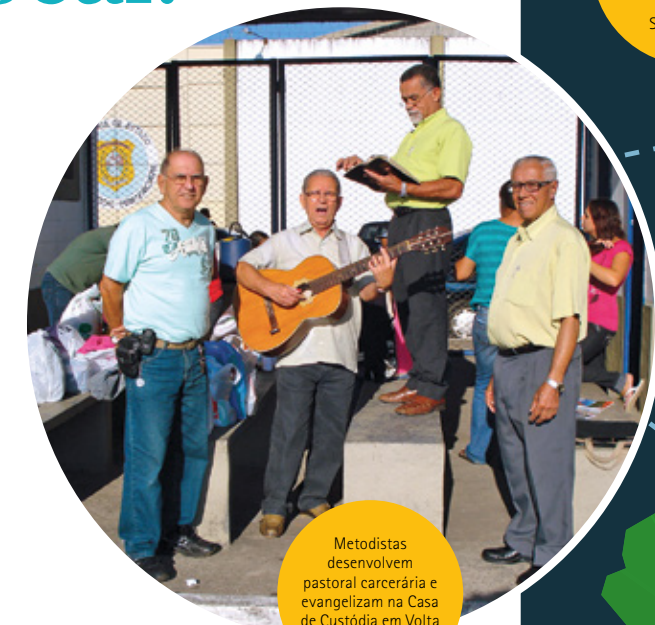
Metodistas desenvolvem pastoral carcerária e evangelizam na Casa de Custódia em Volta Redonda/RJ

Primeiro: convidar as pessoas da igreja local para um encontro de estudo sobre o tema