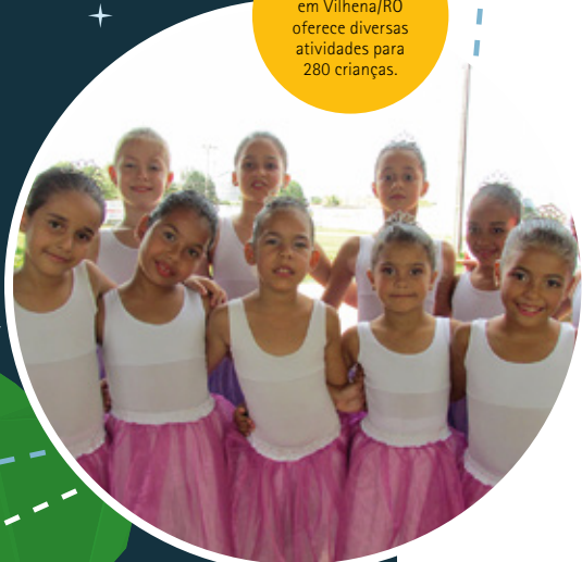
Ação Social da Igreja Metodista em Vilhena/RO oferece diversas atividades para 280 crianças.

A Igreja Metodista foi pioneira em uma doutrina social, com a elaboração de seu credo social, e afirma sua responsabilidade pelo bem-estar integral do ser humano. Desde John Wesley, já era nítida a preocupação com aqueles/as que necessitavam não somente de salvação, mas de uma ação estruturante da Igreja. Ações que visam dar um salto de qualidade e superação de vulnerabilidade sinalizando a vida abundante onde antes havia sinais de morte.