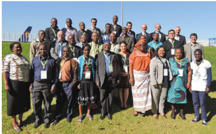
Evento estimulou a produção de literatura teológica em língua portuguesa, escassa em Angola, Moçambique e Portugal

Participaram bispos e bispas da Igreja Metodista Unida em Angola e representantes clérigos/as e leigos/as das Igrejas Metodistas do Brasil, Angola, Moçambique, Portugal e Es-