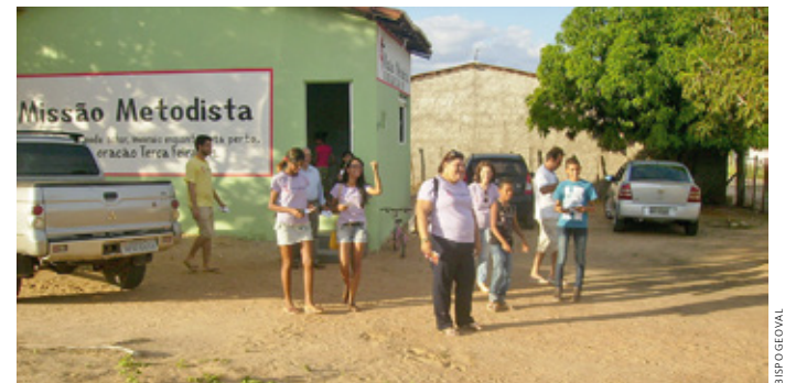
Novo Ponto Missionário da Igreja Metodista foi inaugurado no N10

A Missão Metodista em Petrolina/PE, por ocasião de seus 15 meses de existência, tem um novo avanço missionário no Núcleo de Desenvolvimento Irrigado “Senador Nilo Coelho” N10. A região possui uma população de seis mil habitantes e está a 10 km de distância da rodovia em direção às cidades de Salgueiro e Recife. É uma agrovila formada por trabalhadores e trabalhadoras rurais e pequenos/as proprietários/as de lotes que se dedicam à agricultura e fruticultura beneficiada pelo processo de irrigação.