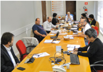
Reunião ocorreu em São Paulo, nos dias 29 e 30 de maio

A Rede Metodista de Educação também fez parte da pauta: sua liderança acolheu relatórios, refletiu e reforçou o pedido