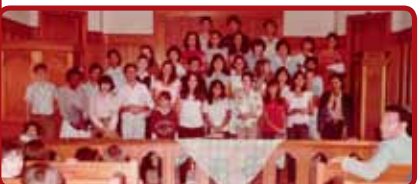
Pastor com os jovens e juvenis da Igreja Metodista em Sorocaba, SP, em dois eventos distritais.