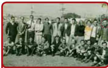
Seminaristas da Faculdade de Teologia da Igreja Metodista em 1966.