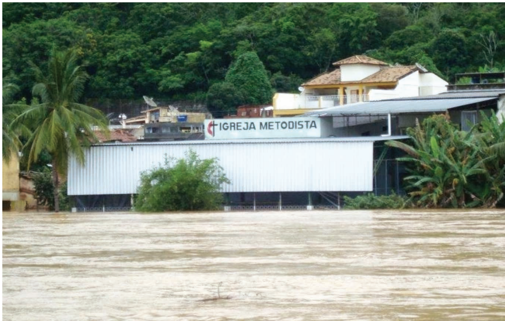
Igreja Metodista em Pádua-RJ ficou ilhada durante as fortes chuvas dos primeiros dias do ano