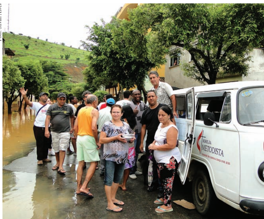
Metodistas de Muriaé-MG distribuem mais de 20 mil marmitas

“Tenho um orgulho muito grande de fazer parte desta igreja! Estamos sendo vistos como a igreja do evangelho prático aqui na cidade”