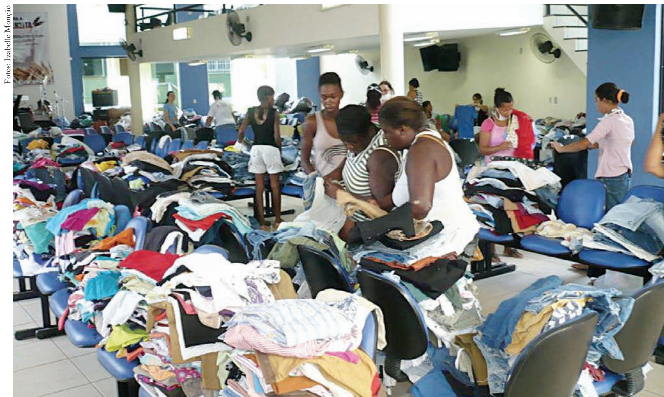
Igreja Metodista Central em Além Paraíba-MG, se tornou uma referência de ajuda às famílias afetadas na cidade

O prédio da Igreja Metodista em Além Paraíba também foi afetado. “A sala de educação