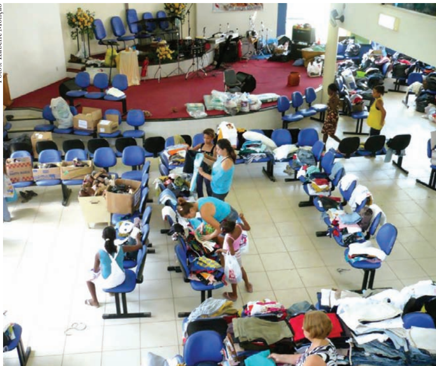
Com doações de voluntários a Igreja Metodista distribui roupas e água aos moradores de Além Paraíba-MG