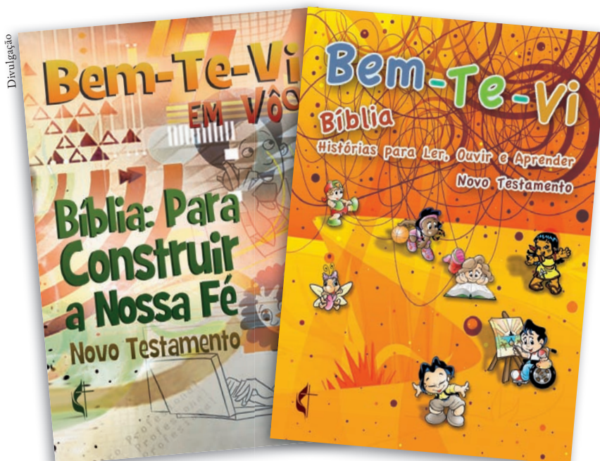
Bem-te-vi em vôo - 10-13 anos

Edison disse ainda que a expectativa para o próximo semestre é grande. “Já temos a quantidade estimada e colocamos no orçamento da Igreja. A Igreja Central de Campinas, rumo aos 100 anos, tem na sua história, dados importantes à Escola Dominical como uma relevante herança Metodista. As revistas têm importante reconhecimento nessa história. Sabemos do