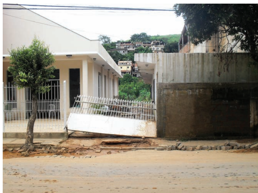
Muro da Congregação Metodista Canaã cai por causa das chuvas

tes chuvas. Na Igreja Metodista Central foi montada uma base de atendimento da prefeitura. Muitos membros e voluntários ajudaram no trabalho. No local, ainda estão sendo distribuídos cestas básicas, roupas, remédios e água.