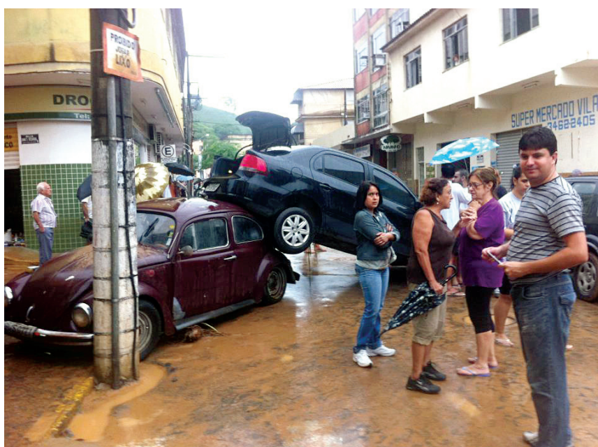
Nesta rua a água chegou ao segundo andar do prédio da casa pastoral