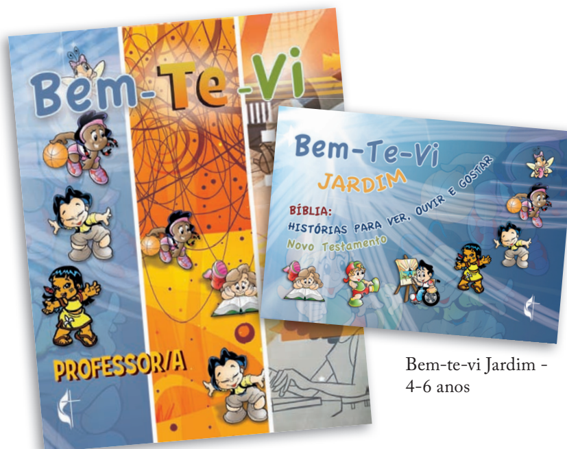
Bem-te-vi - professor/a