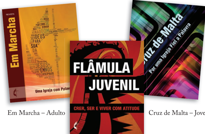
Em Marcha – Adulto

As lições contam com um plano de aula com os objetivos da lição, versículo bíblico base, texto para contar a história, fatos e fotos da realidade que contemplam o contexto de cada região. “O Plano de aula é para as três faixas etárias. O que muda são as propostas de atividades e, claro a postura do professor. Todas as crianças estudam a mesma