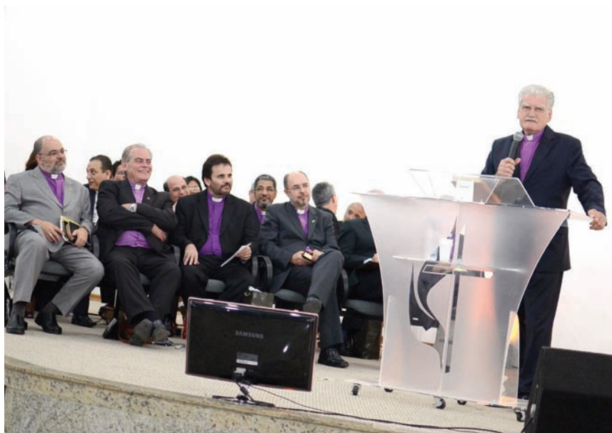
Culto de consagração em Teresópolis-RJ