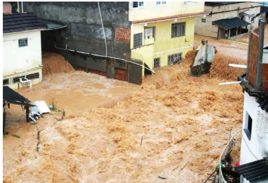
Alagamento próximo a Congregação Metodista Canaã em Além Paraíba-MG