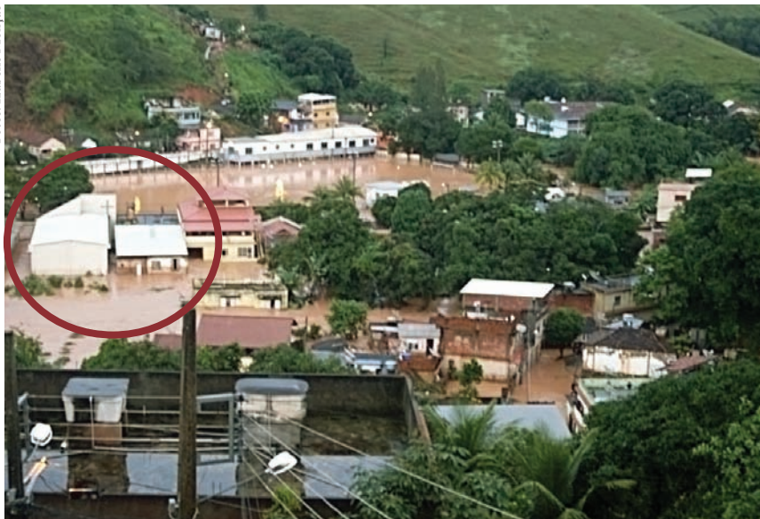
Foto mostra alagamento ao redor da Igreja Metodista em Além Paraíba-MG