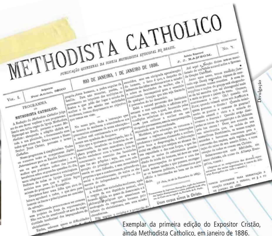
Exemplar da primeira edição do Expositor Cristão, ainda Methodista Catholico, em janeiro de 1886.