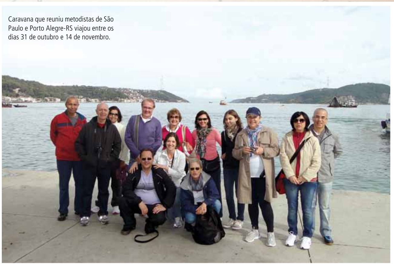
Caravana que reuniu metodistas de São Paulo e Porto Alegre-RS viajou entre os dias 31 de outubro e 14 de novembro.