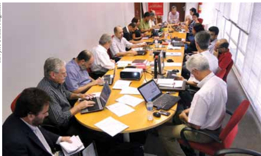
Colégio Episcopal reunido com a Assembleia Geral para avaliação e planejamento estratégico.