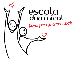
Encontro Nacional de Escola Dominical 2013! Dias 30.05 a 01.06 em Piracicaba! Saiba mais!