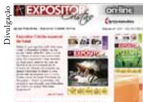
Divulgação Cadastre-se no site para receber toda semana um boletim do Expositor On-Line! Fique por dentro do que acontece na Igreja Metodista!