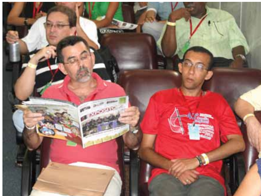
Exemplar do Expositor Cristão é enviado para as Igrejas Metodistas em todo o Brasil.

o jornal conseguiu se adaptar à novidade do rádio, viu-se obrigado a fazer uma autoavaliação à luz de um novo e poderoso veículo: a televisão. Não é diferente hoje com a internet.