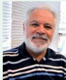
Recildo Narciso de Oliveira Igreja Metodista Central Penápolis - SP