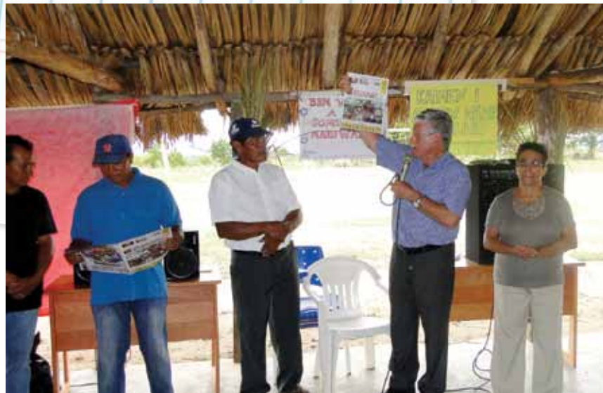
Arquivo Expositor Cristão