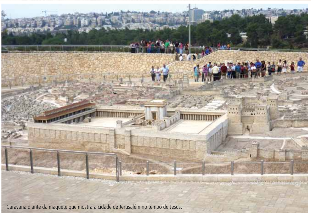
Caravana diante da maquete que mostra a cidade de Jerusalém no tempo de Jesus.