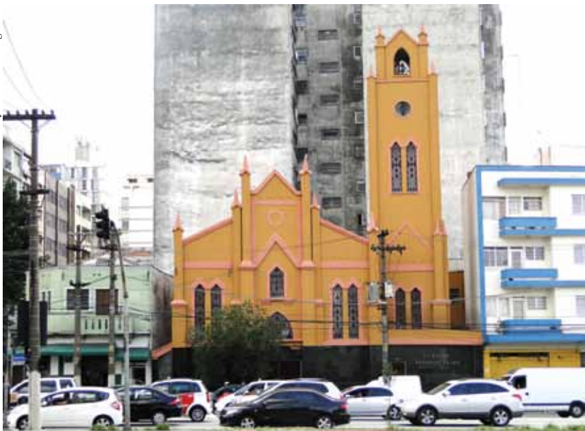
Sede do “No Cenáculo” e do “Disk Oração” na Igreja Metodista da Luz, centro de São Paulo.