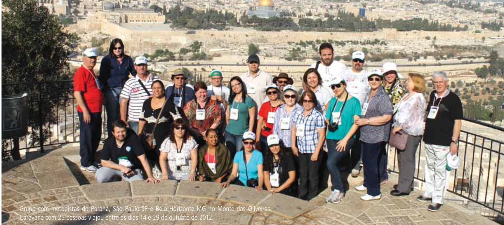
Grupo com metodistas do Paraná, São Paulo-SP e Belo Horizonte-MG no Monte das Oliveiras. Caravana com 25 pessoas viajou entre os dias 14 e 29 de outubro de 2012.