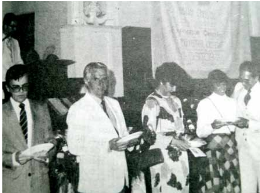
Ex-redatores, redatores assistentes e colaboradores foram homenageados no culto do centenário.