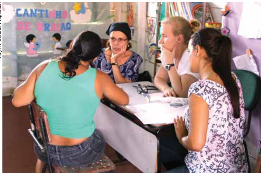
Durante a passagem do Barco Hospital, salas de aula das escolas viram consultórios médicos.