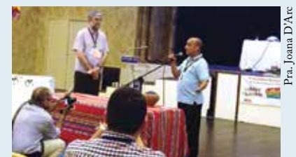
Momento de solidariedade à Cuba arrecadou 11 mil dólares em doações.

Um dos marcos do encontro foi um ato de solidariedade para a reconstrução das áreas cubanas atingidas pelo furacão Sandy, em outubro do ano passado. A Assembleia foi realizada em Cuba como um sinal de solidariedade com a igreja em Cuba, que sofre as consequências de sanções mantidas pelos Estados Unidos. ■