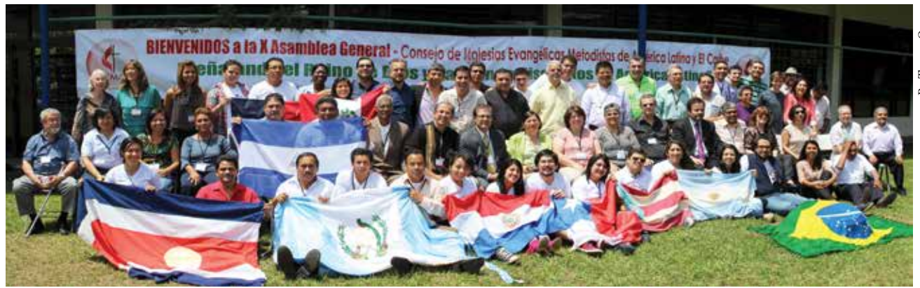
Assembleia aconteceu na Costa Rica e reuniu cerca de 120 metodistas de 22 países.

A Igreja Metodista em El Salvador foi recebida como membro pleno do Ciemal durante a Assembleia. Outro motivo de celebração foi os 15 anos do Programa Jovem em Missão. A juventude expressou-se com um manifesto no qual se compro-