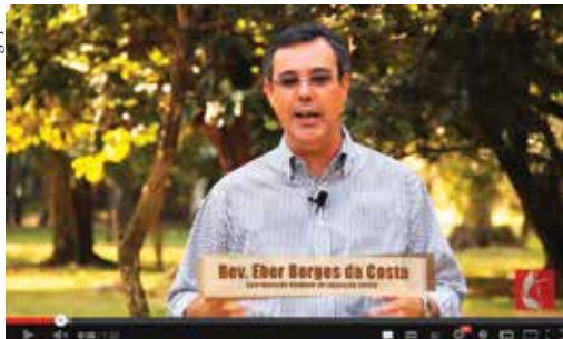
Confira os vídeos oficiais da Igreja Metodista! Acesse: youtube.com/metodistabrasil .