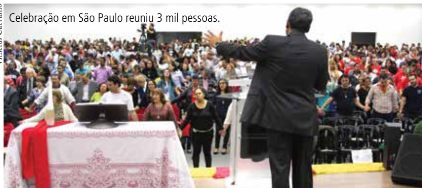
Celebração em São Paulo reuniu 3 mil pessoas.