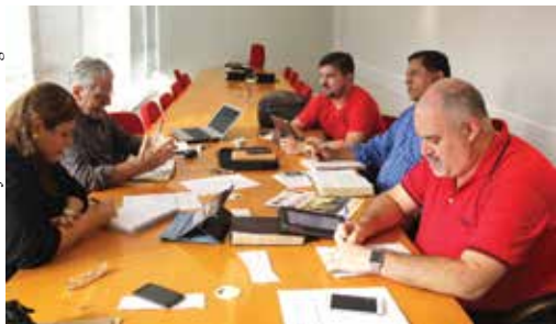
Câmara Nacional de Discipulado reunida em São Paulo! Novidades! Saiba mais!