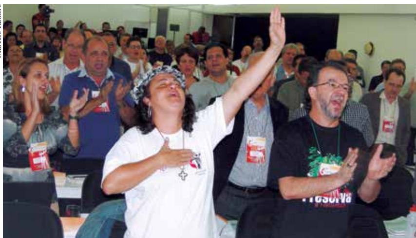
Vibração no plenário do 19º Concílio Geral (2011) após aprovação do avanço missionário.