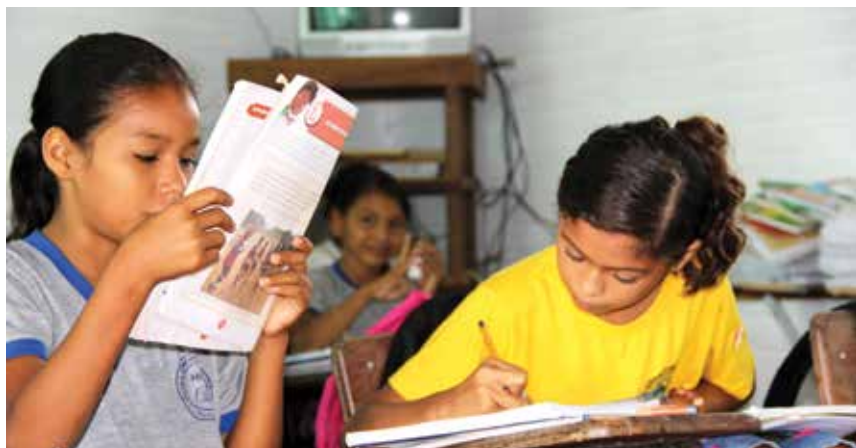
Concentração enquanto a professora voluntária interage com os alunos.

Essa ação surpreendeu também o Secretário de Educação,