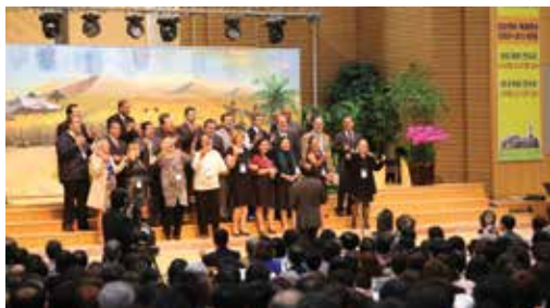
Metodistas brasileiros participam da celebração da Igreja Metodista na Coreia do Sul.