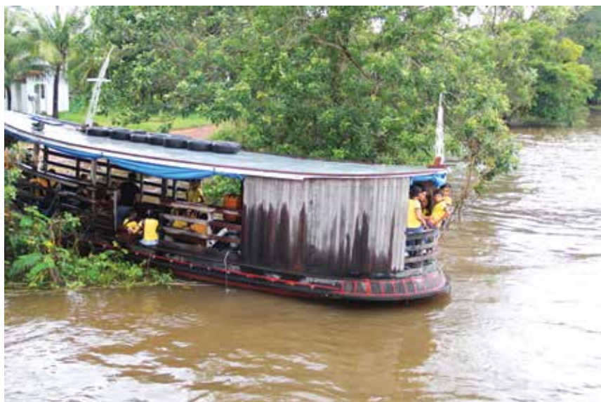
Trabalho metodista faz em média 12 viagens por ano para atender comunidades ribeirinhas.