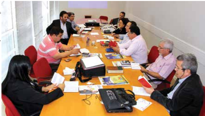
Reunião da Câmara Nacional de Expansão Missionária na Sede Nacional da Igreja Metodista.