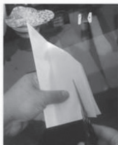
Corte a dobra menor...