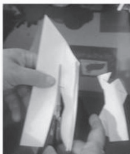
Corte a Segunda dobra menor...