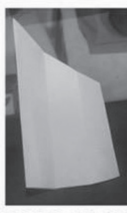
Observe as marcas das dobras