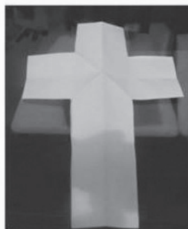
Desdobre a parte maior que sobrou e veja o que restou...