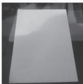
Uma folha de papel A4