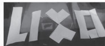
Desdobre as partes menores recortadas e forme a palavra LIXO