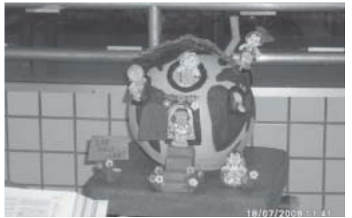
Alegria e criatividade animaram a EBF da Igreja Metodista de Ibatí, Paraná. Vejam só que belo globo terrestre com a turma dos Aventureiros em Missão foi construído para as crianças aprenderem sobre a responsabilidade humana no cuidado com o semelhante e a natureza criados por Deus.