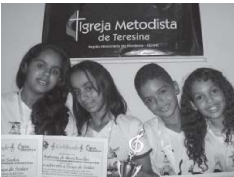
A turminha vencedora do Concurso Crianças Metodistas Compositoras, toda feliz com seus diplomas e o troféu. O próximo concurso já tem data marcada: músicas sobre Escola Bíblica de Férias e sobre o tema: “Aventureiros em missão: A aventura de caminhar com Cristo” devem ser enviadas ao Departamento Nacional de Trabalho com Crianças até o dia 14 de dezembro. Veja na próxima edição do Expositor o regulamento do concurso ou acesse o site www.metodista.org.br .