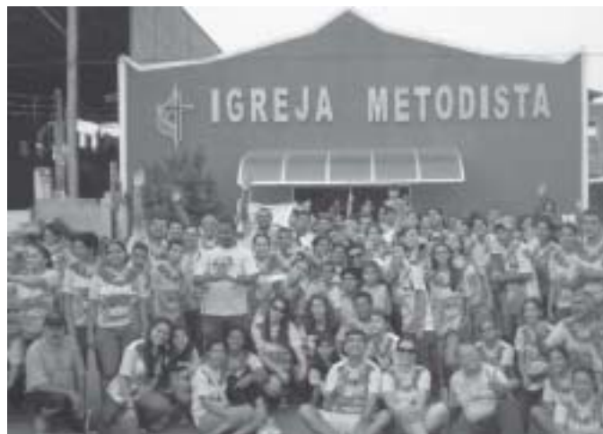
Igreja Metodista em Jarú, Rondônia.