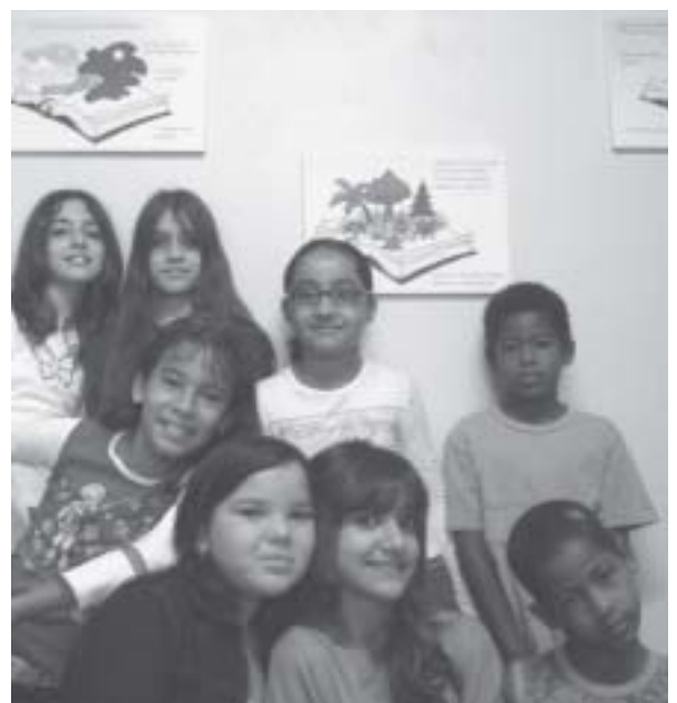
As crianças da Igreja Metodista em Capivari, estado de São Paulo, na sala enfeitada com o poema ilustrado feito especialmente para elas pelo bispo Luiz Vergílio Batista da Rosa da Segunda Região Eclesiástica (texto) e pastor Sílvio Gonçalves Mota (ilustrações).