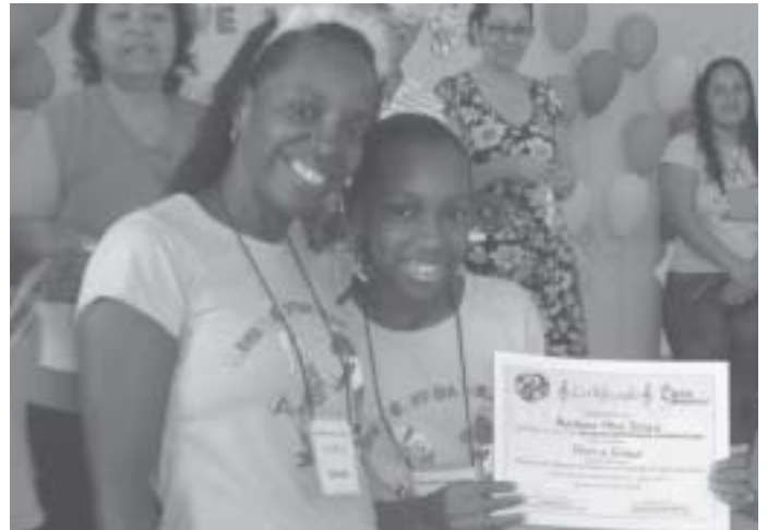
A alegria da criançada da Igreja Metodista de Goiabeiras, Vitória (ES), recebendo os diplomas de participação no Primeiro Concurso Crianças Metodistas Compositoras. A produção coletiva aconteceu após um estudo sobre o lema da Igreja “Testemunhar a Graça e fazer discípulos e discipulas”.